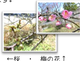
←桜 ・ 梅の花↑