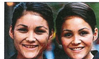
22歳の双子の40歳時を予想した写真(左が喫煙した場合) 顔色が悪く、肌に張りなくなりシミやそばかすが増え、乾燥した肌の多い皮膚になる。歯にはヤニがつき、歯肉の色も悪くなる。タバコは10年以上老化を促進させる。 Women unaware of smoking risks http://www.kinennomori.com/nikki_kobetukiji_69_kyohya.html

喫煙を続けていると、皮膚にしわがでたり、ハリがなくなるなど、いわゆる「たばこ顔」と呼ばれるような状態になります。