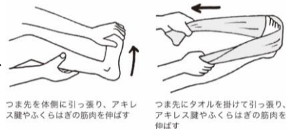
つま先を体側に引っ張り、アキレス腱やふくらはぎの筋肉を伸ばす

縮んだままの筋肉を伸ばすことで改善されます。この際、無理に伸ばすと肉離れの原因になるので、ゆっくり伸ばしましょう。痛みが治まってきたら、患部のマッサージを行い再発を予防します。